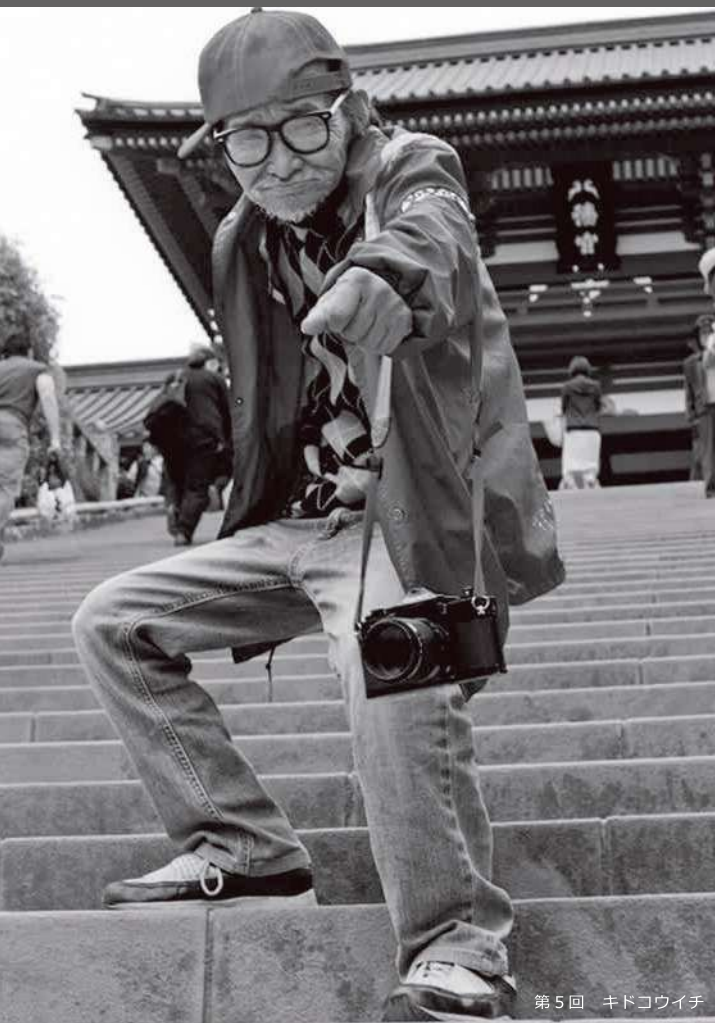
第5回 キドコウイチ