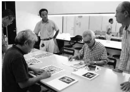
講評会に向けて公募写真を確認する英氏と美術館サポーター。