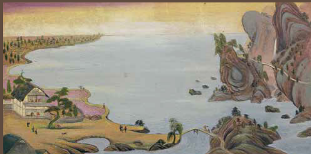
小川天香 《風景画 海》 1937-38年頃 茅野市美術館蔵