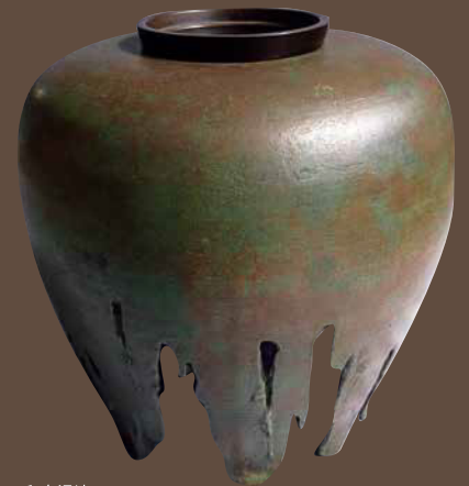
和泉湧清 《蠟型蠟焼流し青銅花器》 1964年 市立岡谷美術考古館蔵