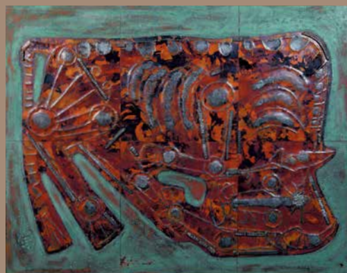
宮坂房衛 《エデンの牛》 1958年 諏訪市美術館蔵