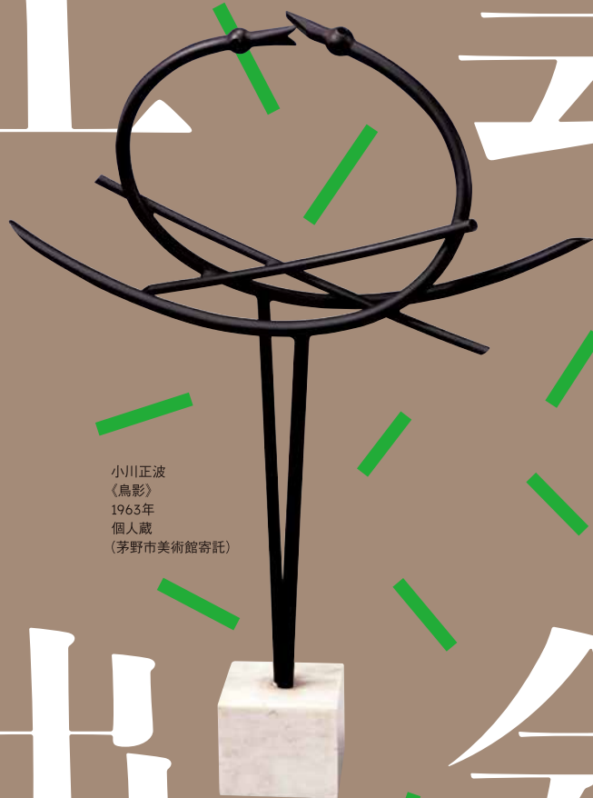
小川正波 《鳥影》 1963年 個人蔵 (茅野市美術館寄託)