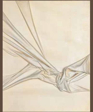
柳澤香樹 《大自然の躍動》 1987年 茅野市美術館蔵