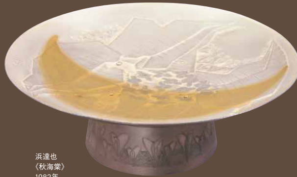
浜達也 《秋海棠》 1982年 諏訪市美術館蔵