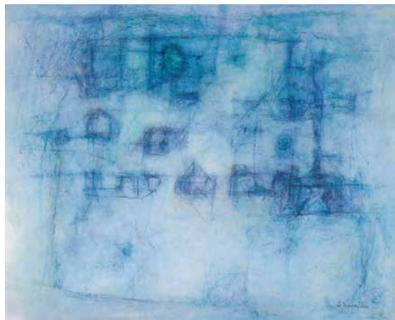
吉江新二 YOSHIE Shinji 吉江新二「青い風景」1980年