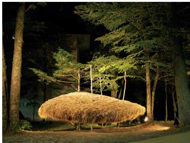
塚田裕 TSUKADA Hiroshi 塚田裕「sky cloud」2010年