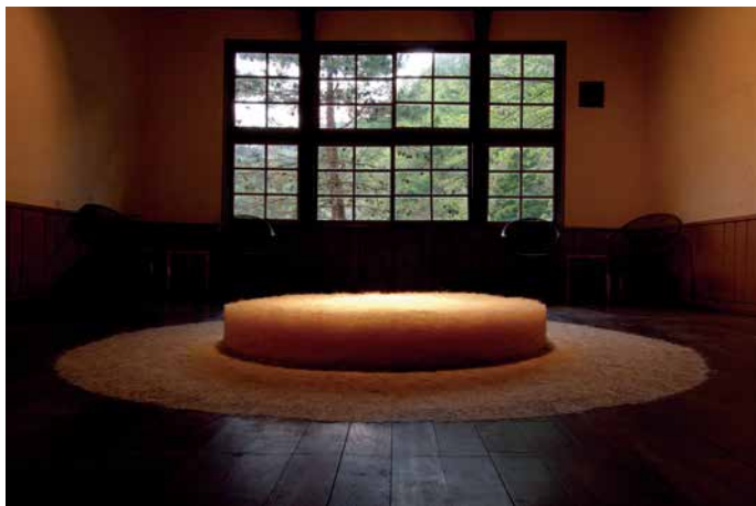
天野惣平 AMANO Sohei 天野惣平「無題」2012年