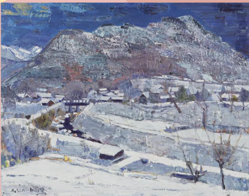
篠原昭登《小泉山雪》1988年