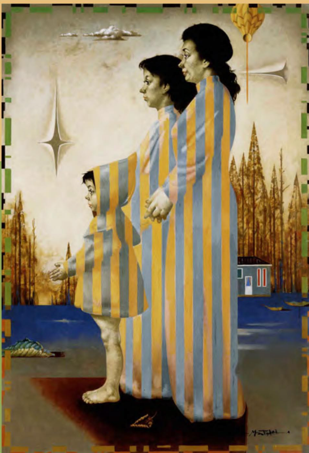
松樹路人《から松のなかに》1995年