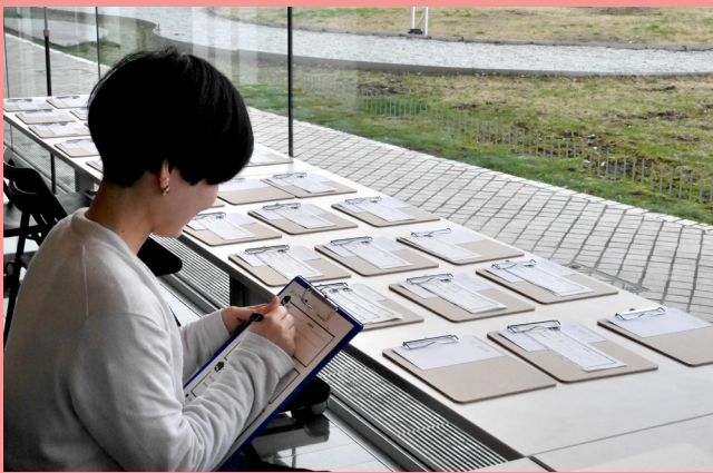
応募用紙にタイトルを記入