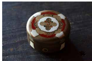
⑬瀬尾誠 せおま こと 《コラボ 古金胎色漆文ヤンボ》2015年