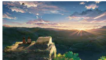
②新海誠 しんかい まこと 《星を追う子ども》2011年 ©Makoto Shinkai/CMMMY