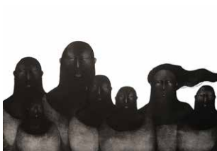
⑯青山由貴枝 あおやま ゆきえ 《日常風景》2011年