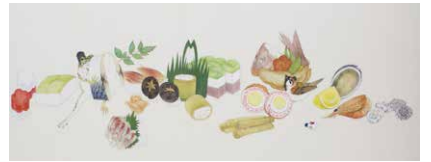
⑨中村恭子 なかむら きょうこ《皿鉢繪》部分 2015-16年