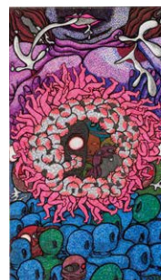
⑲鮎万里絵 すずき まりえ 《崩れてしまえばいいのに》 2011年