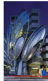
④サム・プリチャード 《LAND OF TECHNOLOGY Iidabashi Station》2014年