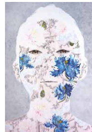
③深沢尚宏 ふかさわ ひさひろ 《Tranquility no.26 / face》 2015年