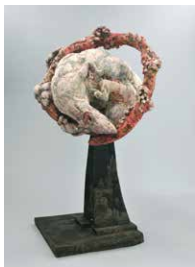
⑪小野寺英克 おのでら ひでかつ 《空に溶け込む動物2》2012年