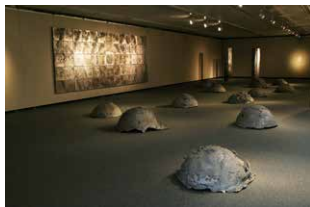
⑫角居康宏 すみい やすひろ 《はじまりのかたち》2007年