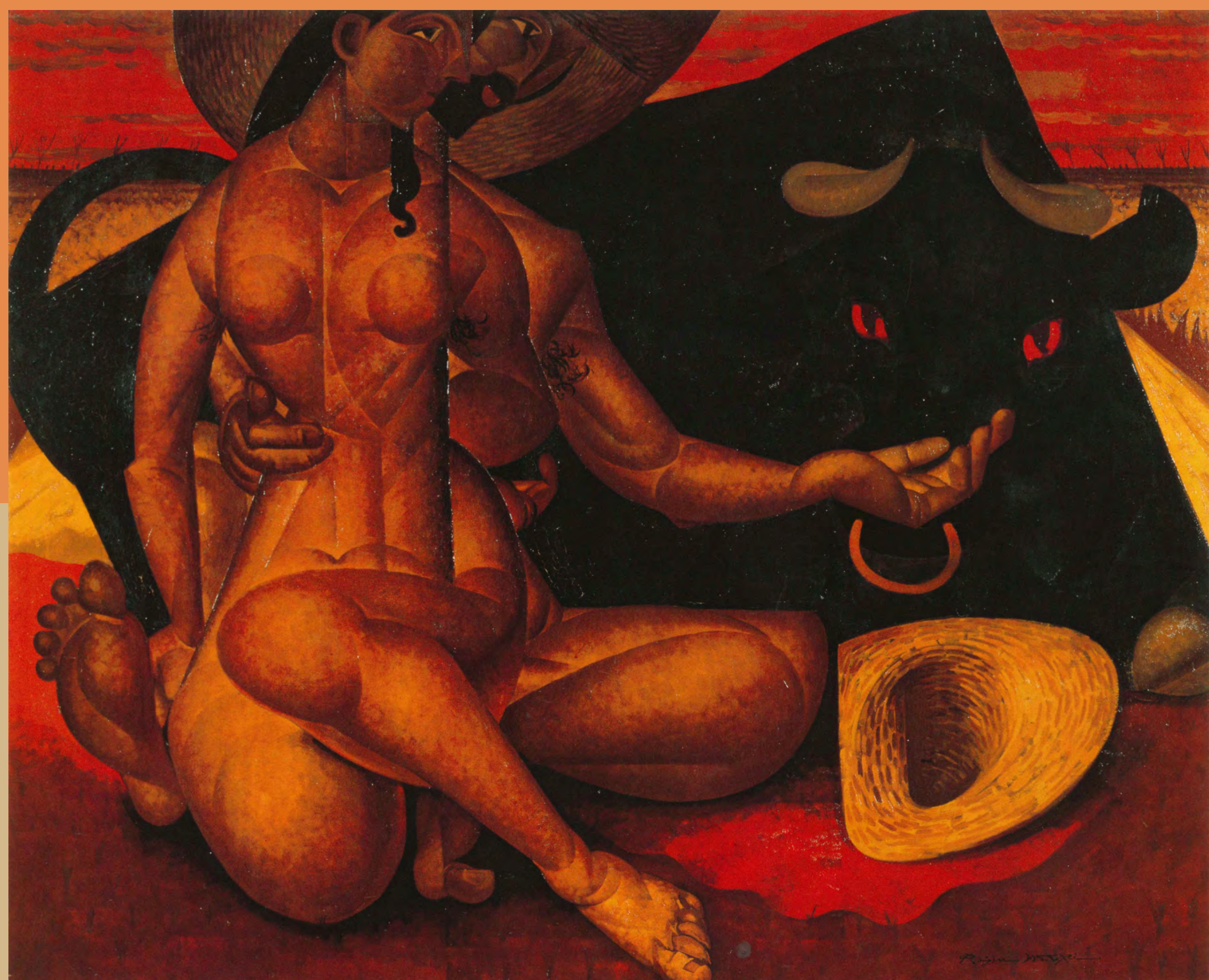
上/松樹路人《去りゆく夏に—静かな対話》2001年 下/松樹路人《原野(牛)》1957年