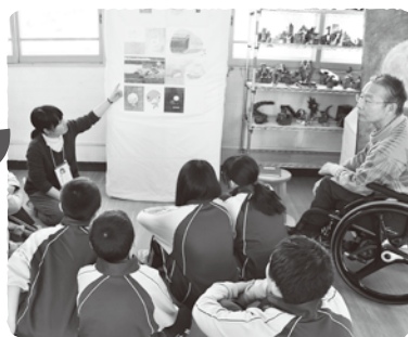
茅野市立永明中学校(2015年2月)

また、茅野市美術館においても講座を開催します。学び合いながら美術を楽しむ「旅するムサビ」の活動をぜひご体験ください。