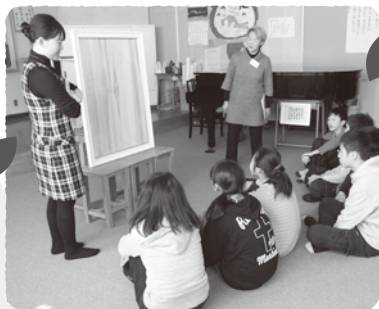
茅野市立米沢小学校(2013年1月)

ムサビ生(武蔵野美術大学)と教授が全国各地の学校を旅して、学校、美術館、地域の子どもと大人を巻き込んで、鑑賞・造形活動とともに学び合いながら展開している「旅するムサビ」。2012年度は茅野市、2013年度は諏訪市と茅野市、2014年度と2015年度は岡谷市と茅野市で開催しました。ムサビ生と地元作家の作品を、小中学生がファシリ