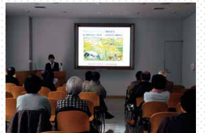
茅野市ミュージアム・コンシェルジュ講座(茅野市尖石縄文考古館)

茅野市内の博物館・美術館6館の連携事業。茅野市美術館が事務局を担当。スタンプラリーやパネル展示、ワークショップ、観光事業者向けの講座、シンポジウムなどを開催。