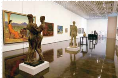
収蔵作品展「地域をみつめる—紡ぐ—」

様々なジャンルの1,000点を超える茅野市美術館収蔵作品からテーマを設定し、各年度4期に分け展示をしています。