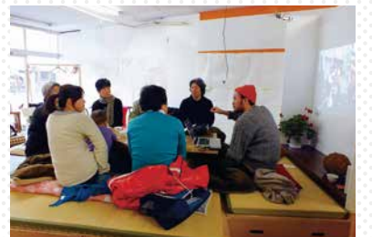
アート×コミュニケーション茅野#1 「つなぐづくり」で、「つなぐ人づくり」の連携講座 第4回公開トークイベント 「アート×コミュニケーション×まちづくりII」