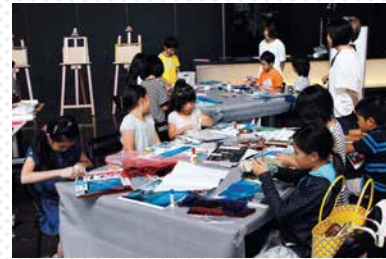
生誕100年 矢崎博信展 幻想の彼方へ 関連企画 美術教室「矢崎さんの夢の絵に、自分の夢をかきかえよう」