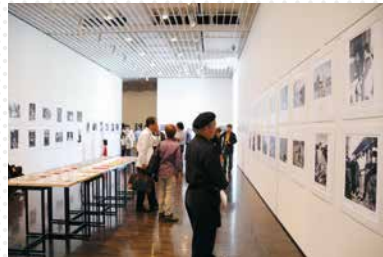
寿齢讃歌—人生のマエストロ—写真展

おおよそ80歳以上のお年寄りを被写体とした公募写真展。サポーターが企画・制作を担当します。