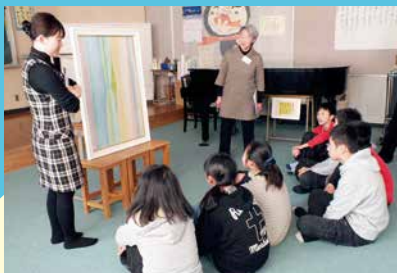
茅野市美術館を一緒にサポートしませんか+1 特別講座「旅するムサビ」がやってくる! 2013年1月

※当事業は文化庁「地域と共働した美術館・歴史博物館創造活動支援事業」の補助事業です。