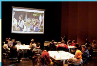
茅野市美術館を一緒にサポートしませんか+2 第3回「茅野市美術館サポーターの活動」2014年2月