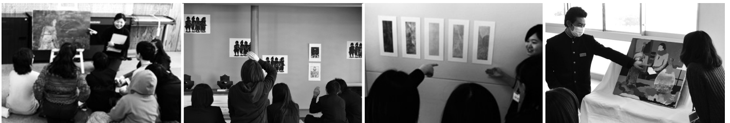
「旅するムサビ」がやってくる! 2014年2月 諏訪市立高島小学校、茅野市立北部中学校