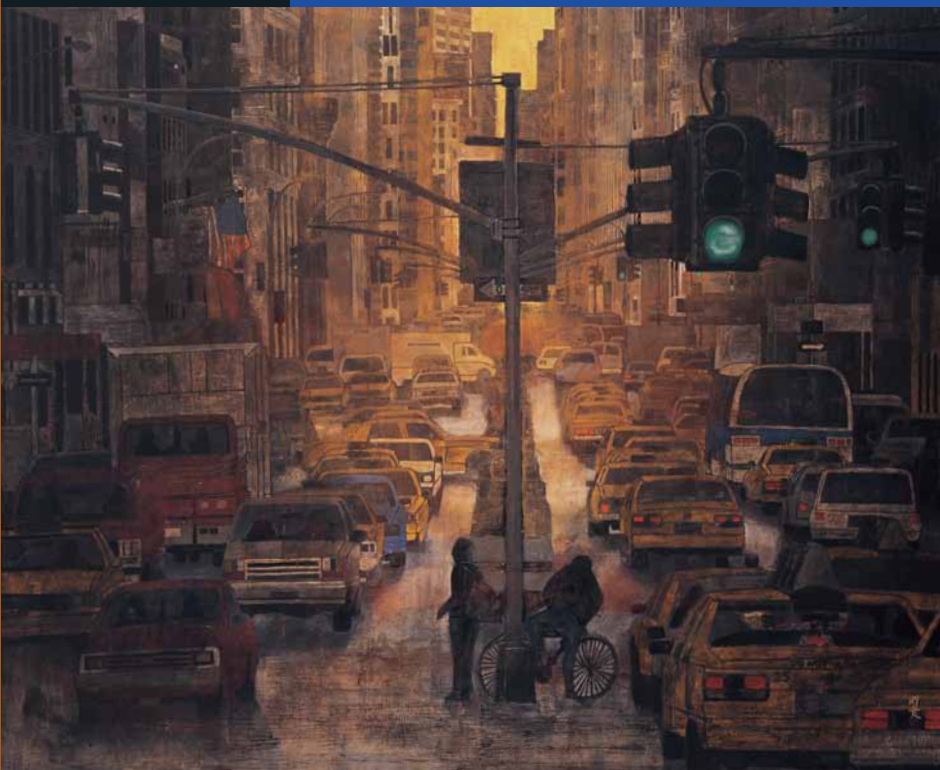
岩波昭彦《ラッシュ・アワー》2001年