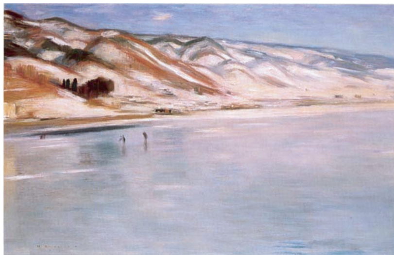
金山平三 《結氷》 1931年

◎イベント情報 会期中、対話型ギャラリーツアーを行います。参加費無料。(観覧料は必要) 詳細は、長野県信濃美術館までお問合せください。 お問い合わせ先:026-232-0052