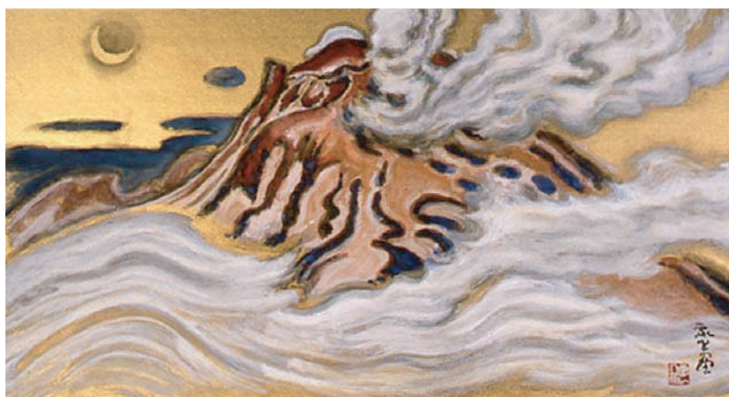
小山敬三 《紅浅間》 1982年