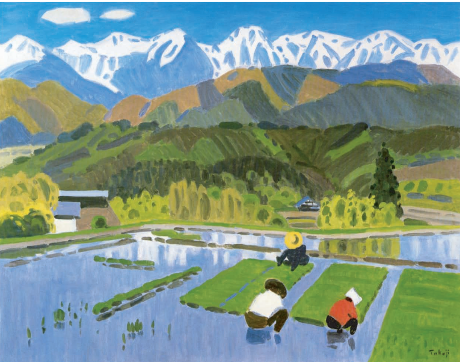
中村琢二 <伊那谷の春> 1979年