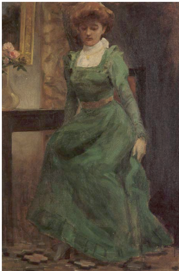
中村不折 《西洋婦人像》 1904年頃