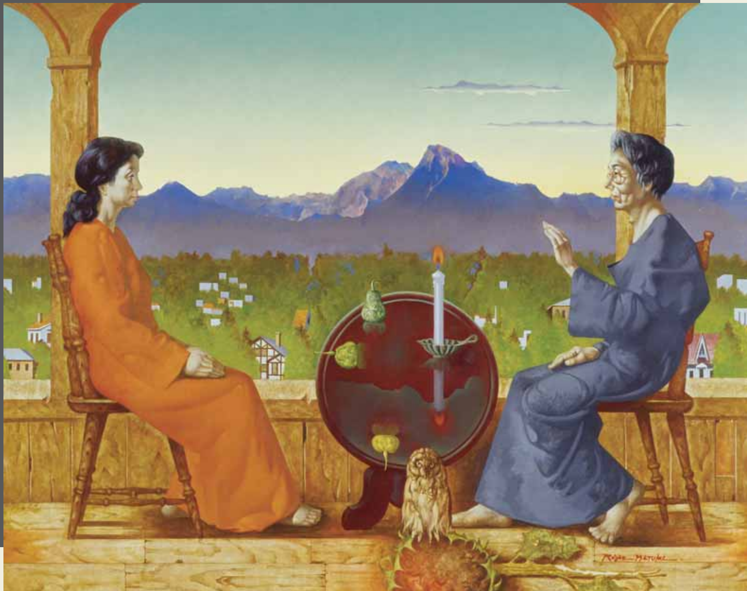
松樹路人「去りゆく夏に - 静かな対話」2001年