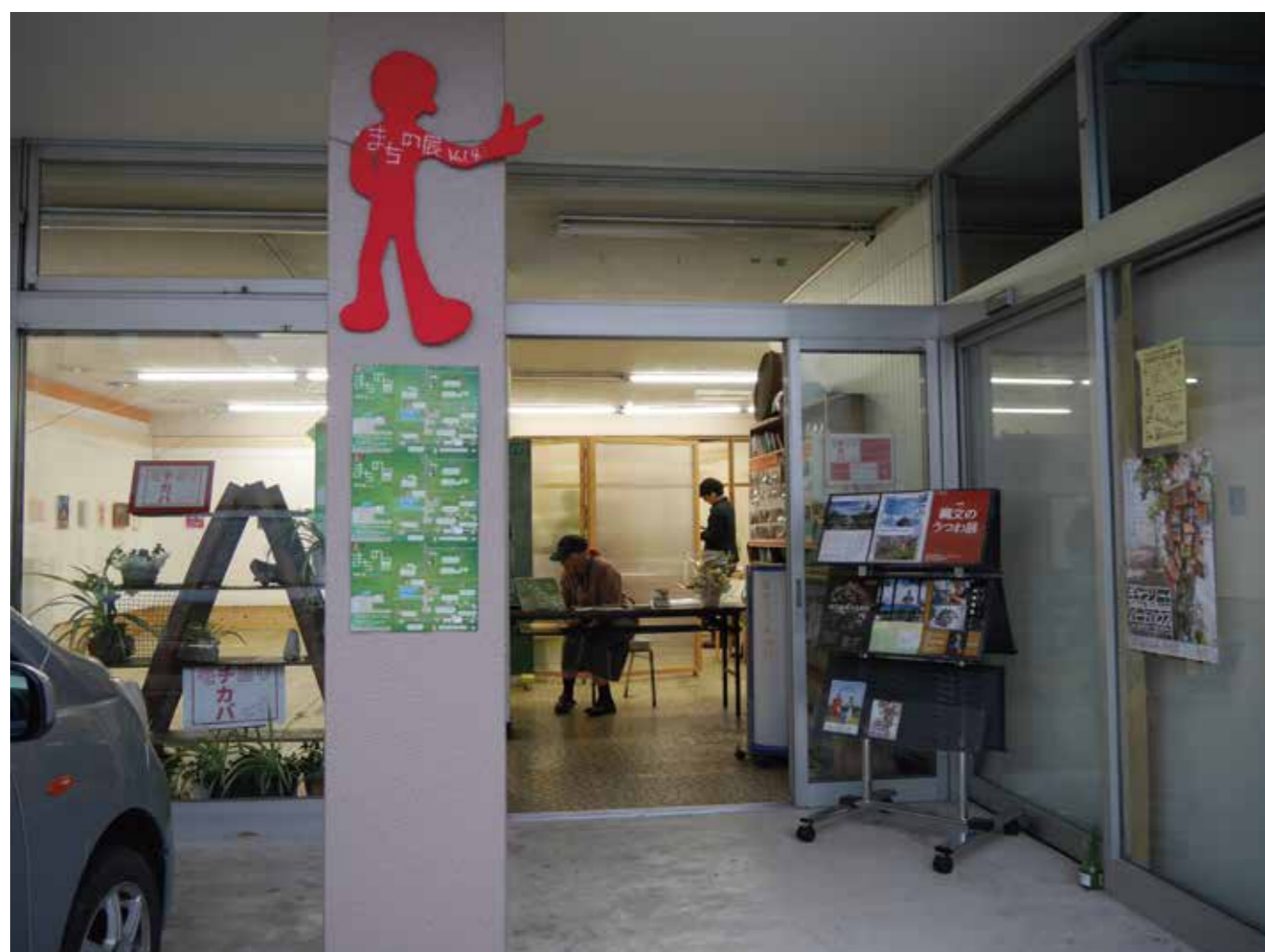
市民館を真ん中に、茅野駅の西口と東口をアートでつなぐまち巡り。

「ルートを決めて街めぐりってのも面白いね」 「住んでるから、よく知ってる街のはずんだけど、新しく知る場所があった」 「こんなお店もあったんだって。初めて入ったよ」 「お店と作品の雰囲気もあってたね」 「作家さんがいたら直接話を聞いたり、こちらから質問したりもできて良いね」 「歩くことで違う場所を知ることができるね」