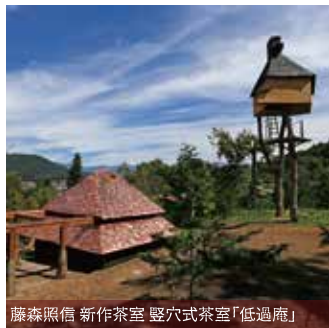
麻森照信 新作茶室 竪穴式茶室「低過庵」