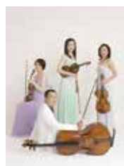
[出演] カルテット・エクセルシオ

☆3歳からのお子さん向けの内容ですが、0.1.2歳のお子さんのご入場も可能です。託児サービス(要事前申込み)もごございますのでご利用ください。