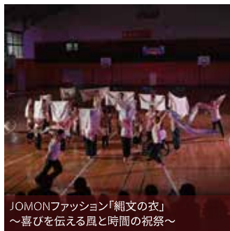
JOMONファッション「縄文の衣」～喜びを伝える風と時間の祝祭～