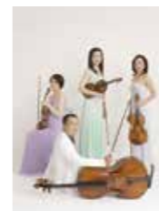
[出演] カルテット・エクセルシオ

☆3歳からのお子さん向けの内容ですが、0.1.2歳のお子さんのご入場も可能です。託児サービス(要事前申込み)もごございますのでご利用ください。