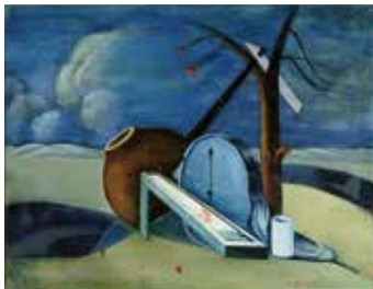
矢崎博徳《幻想》1938年頃