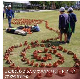
こどもたちとみんなのJOMONアートワーク (学校教育連携)