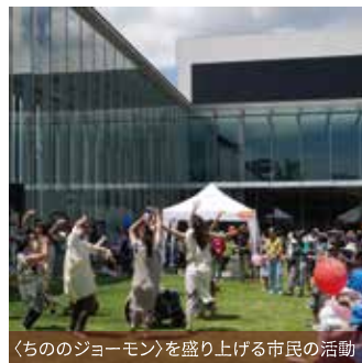
「ちののジョーモン」を盛り上げる市民の活動