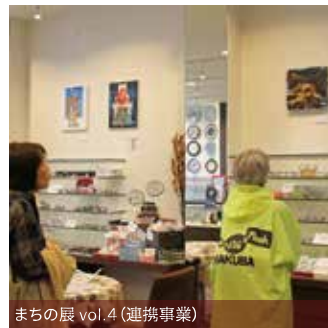
まちの展 vol.4 (運搬事業)