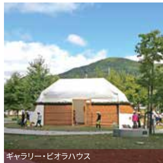
ギャラリー・ピアノハウス