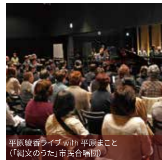
平原綾香ライブ with 平原まこと (「縄文のうた」市民合唱団)