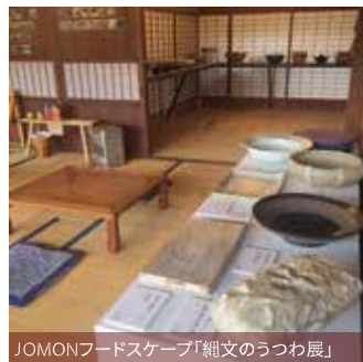
JOMONフードスケープ「縄文のうつわ展」