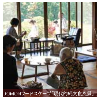
JOMONフードスケープ「現代的縄文食風景」