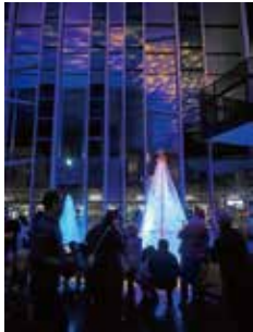
12/1の点灯式ではクリスマスにちなんだものを身に付け、ランプシェードをつくって素敵な景色とともに彩りました。