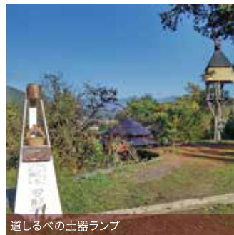
通じるべの土器ランプ