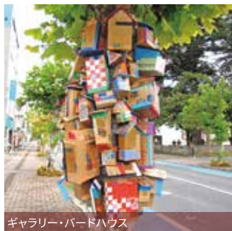
ギャラリー・バードハウス