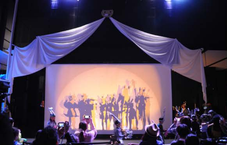
かげとあそぼう えほんのせかい (2015.10.14)