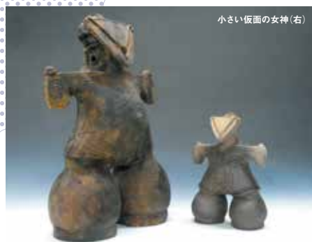
小さい仮面の女神(右)