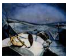
矢崎博信「高原の幻影」1938年 諏訪市美術館蔵

茅野市出身で、日本のシュルレアリスム(超現実主義)絵画の先駆者・矢崎博信(1914-1944)の画業と思想を振り返ります。