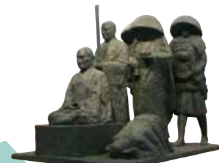
矢崎虎夫「雲水群像」1971年