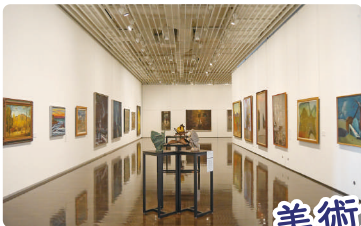
過去の収蔵作品展の様子