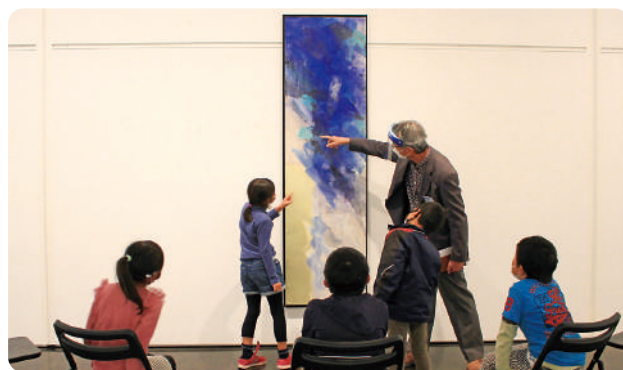
まなぶ編「見るを楽しむ～対話による作品鑑賞～」(2020年10月) 美術館サポーターがファシリテーター(ガイド)を担当