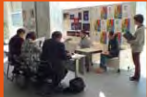
「ステージづくり応援部」公開記者会見