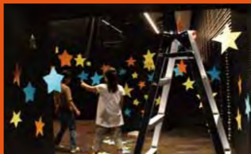
「小さな子どものすてきな時間」デコレーション