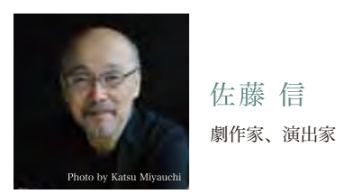
佐藤 信 劇作家、演出家

66年に「アンダーグラウンド・シアター自由劇場」の結成に加わり活動を始める。70年に「黒色テント68/78」(現、劇団黒テント)を立ち上げ、同劇団の作、演出を担当。「アジア演劇」「演劇の公共性」「演劇と教育」など、演劇と社会の境界をめぐる発言と実践をつづけている。現在、座・高円寺の芸術監督を務める。また、個人劇団「鴉座」を主宰。