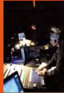
「第6回諏訪地区 高校演劇連盟合同公演」