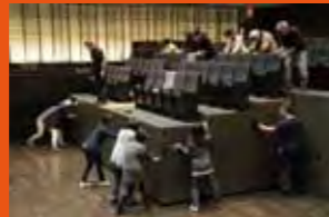
「ステージづくり応援部」 客席移動しませんか?