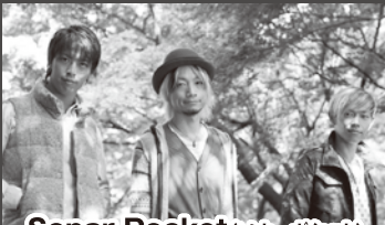
Sonar Pocket (ソナーポケット)

2008年、twenty4-7が培ってきた全てを納めた1stアルバム「Life」をリリース。2009年2月には、2ndアルバム「PROGRESS」をリリース。このアルバムの中に収録された「Get A Life〜Again〜」は映画「余命」の主題歌に抜擢された。その他にもfeat.アーティストにAK-69 a.k.a. Kalassy Nikoff、Kayzabro (DS455)、「E"qual (M.O.S.A.D.)、DJ PMX (DS455)を迎えた楽曲などが収録され、新たな境地を開拓した一枚となった。その後のRELEASE TOURでは東名阪の全国3か所をまわり、チケットは各会場全てSOLDOUTに。7月には、10周年を迎えた元祖R&BクインDOUBLEの名曲「Shake」をカバー。DVD初回盤には先日の「PROGRESS RELEASE TOUR」の大阪公演の様相を収録した内容となっている。現場を沸かし続ける熱いライブとともに、タフなルックスに秘められたエモーショナルなメッセージを今後も届け続ける。