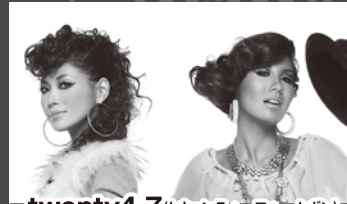
twenty4-7 (トゥエンティフォーセブン)

1999年「あなたとふたりで〜Be with me all day long〜」でクラブシーンに鮮明なデビューを果たし、1st full al「Eternal Voice」でその存在を不動のものとする。多くのファンからのリクエストにより実現した10年振りのセルフリミックス楽曲「耳もにほ〜Ring the bells REPRISE〜」でも、配信がスタートしたと同時に10万DLを突破、シーンに改めてその力を示した形となった。続く2009年12月9日には、待望の2nd full al「I AM」をリリース。2010年10月20日、傳田真央3rd al「恋愛中毒」をリリース。本作は、詩・曲・アレンジ・サウンドプロデュースのほとんどを自身が手掛け、「イマドキ大人女子代表」としてリアルな恋愛模様を綴った13曲を収録。涙の代弁者として、女性を中心に幅広く愛され、唯一無二の歌声、言葉、ソングライティングセンスでファンのみならず、多くのアーティスト達にも影響を与え続けている。